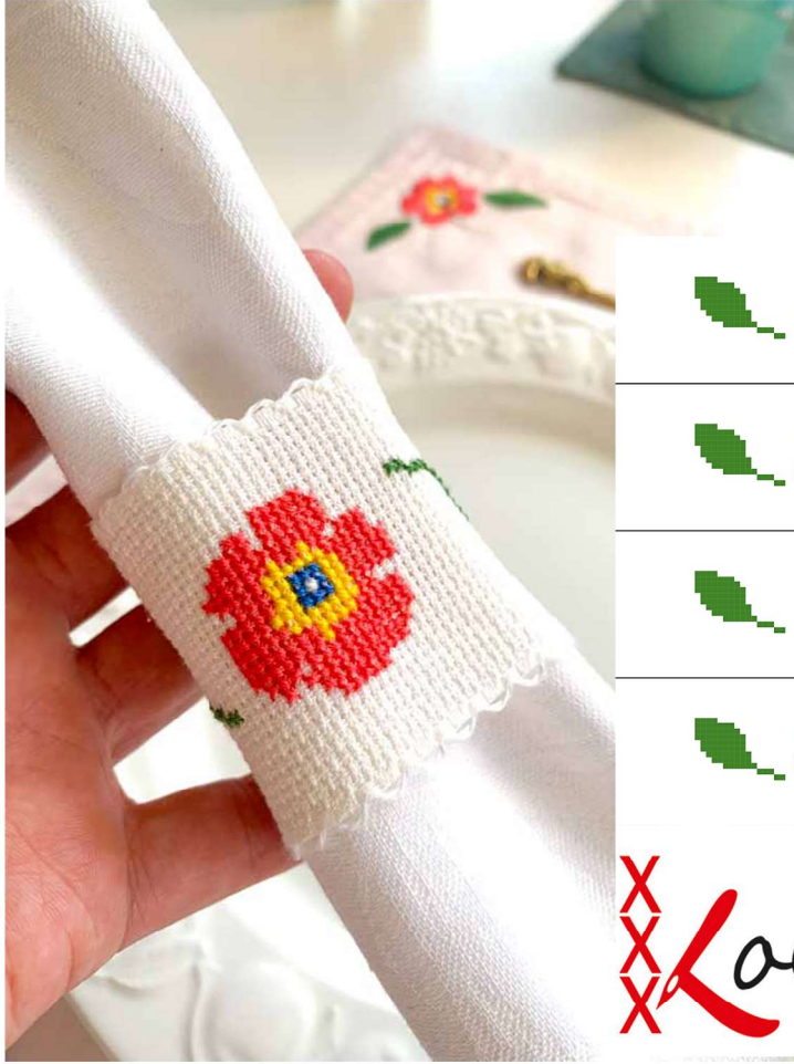
Summer napkin rings Stitched on Aida ribbon